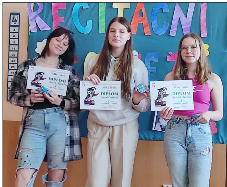
Recitátoři z 2. stupně