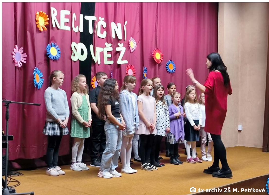
4x archiv ZŠ M. Petřkové

Láska možná je jako Večernice plující černou oblohou. Ale co je to za blbost, že mrtví milovat nemohou? Ale jak vlastně poznáme, že jsme živí? Protože vidět, jak někdo někde stojí, neznamená, že žije. Co když jen přežívá? A to pak nemůžeš říct, že si to užívá, spíš ho to užívá. To, jak tam musí stát, aniž měl důvod se smát, nebo ráno vstát, o život se neustále bát, že tě někdo zraní. A z toho mu srdce zkamení... A co když ztráta kapitána je jen znamení, protože co když tvoje loď do přístavu nedopluje? To se pak celá plavba strašně špatně opakuje. A ve vězení ti nepomůžou ani svatební kytky, když v sobě musíš hledat zbytky naděje, že Život stojí za to. Láska je jako Večernice, to nepochybuji... Ale má duše je mrtvá a přesto miluji. Protože i když nechceš sebevíc, vždyť ti zhasne i poslední svíce.