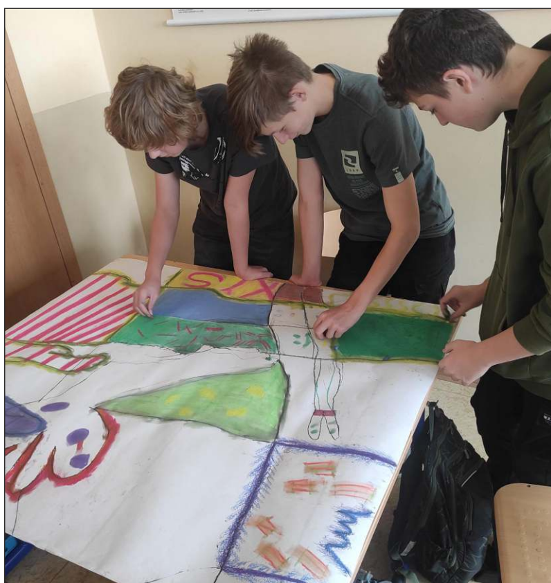
Kreslení stínů a dokončení abstraktních obrazů. – žáci 8. B