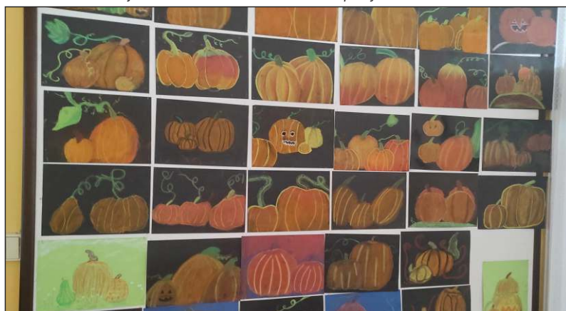
Šestáci kreslili dýně pastelami na barevný podklad podle „živých“ předloh