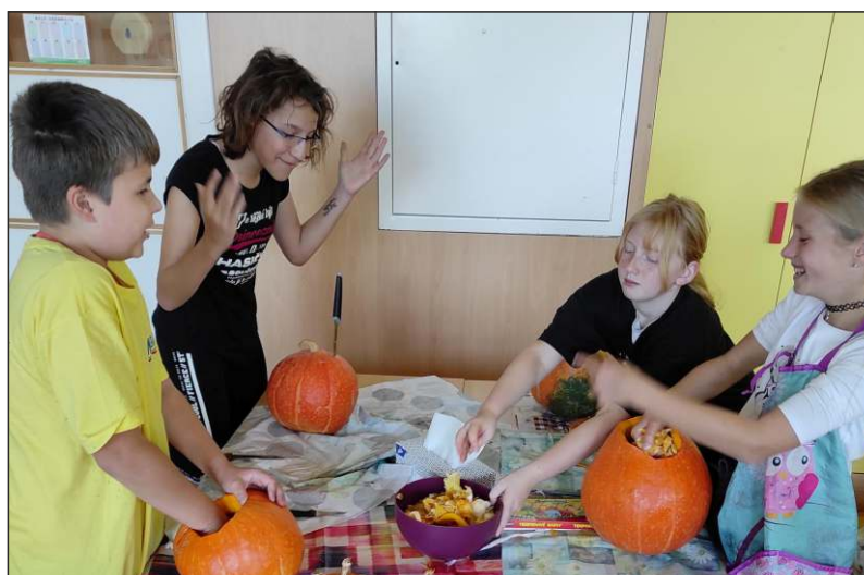
Výtvarný kroužek - spolupráce - vyřezávání dýní jako dekorace na Halloweenskou párty ve Stodole